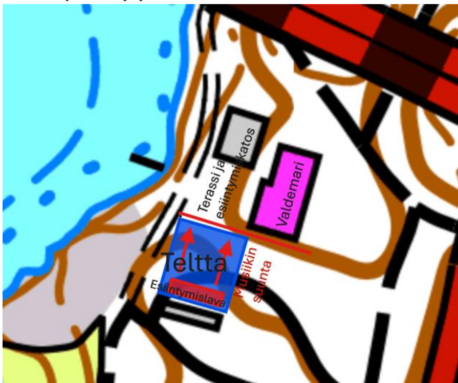
Kuva 2. Esiintymislavan sijainti ja suuntaus tapahtuma-alueella.